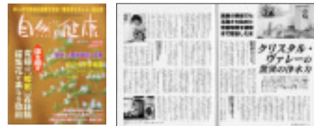
■「自然と健康・10月号」より

○「自然と健康 10月号」において、歯科治療にクリスタル・ヴァレーが利用され院内感染防に役立っている事が紹介される。